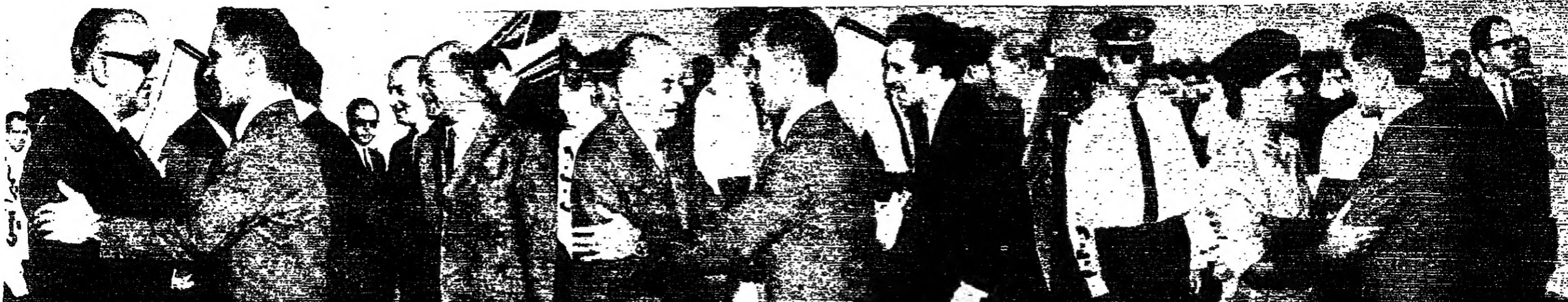
عمان - ١١ - عاد إلى عمان بعد ظهر أمس جلالة الملك الحسين الملقب بـ «الملك» الذي أجرت لجلالته عملية جراحية ناجحة في أحد مستشفى لندن وعاد في معه جلالتة سمو الأمير محمد العظم والكثير شوكه السليبي الطبيب الخاص والسيد الرضاوي الأمين العام للبيروت الملكي الهاشمي . وقد جرى اجلاء الحسين في مطار عمان استقبال رسمي حافل . وكان في مقدمة المستقبين سمو الأمير حسن ولي العهد المظلم وجملة السيد بهجت القلواني رئيس الوزراء ، وسعادة الشريف حسين بن ناصر رئيس الديوان الملكي الهاشمي ، ورئيس مجلسي الاعيان والقواب ، والوزراء ، والاعيان والشباب ، ووزراء البعثات الدبلوماسية ، وكبار رجال الدولة والجيش والامن العلم .

تسليح قينا - د. ب. أ - انضمت اللجنة المركزية للحزب الشيوعي في مقاطعة سوفيا قرارا يرفض أي مفاوضات مستقلة . محاولة فصل بلديتها عن جمهورية تشيكوسلوفاكيا وتحولها إلى دولة مستقلة . وقالت محطة اذاعة تشيكوسلوفاكيا الحرة أن مؤتمر اللجنة المركزية الذي انعقد أمس في براتيسلافا عاصمة تشيكوسلوفاكيا اتخذ قرارا بشجب الاحتلال السوفياتي لتشيكوسلوفاكيا ، واضدهمها على نفسه بالقبض على طريق الاشتراكية ، وأعلن أن السوفيات يريدون الجيش موحيين في دولة تدريجية تهيبة . البقية على الصفحة الخامسة عمود ٦